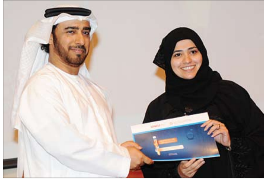
عدد 32 طبيبياً