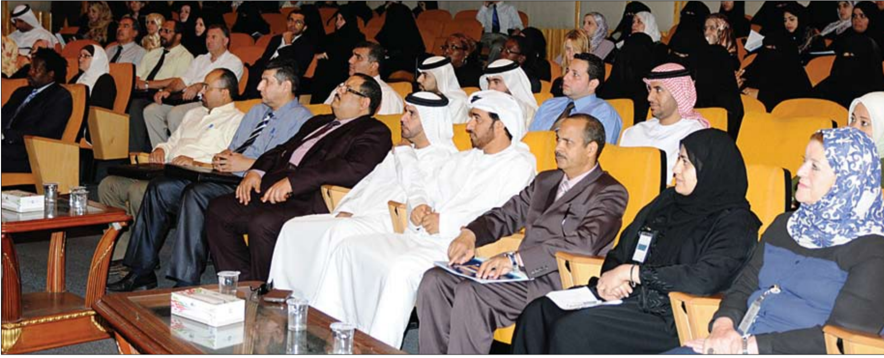
استضافة جامعة الإمارات